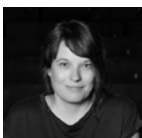
Katharina Riedler

Jeder Mensch sammelt individuelle Erfahrungen beim Aufwachsen, im Privatleben und auch im beruflichen Kontext. Diese sind unter anderem davon geprägt, in welchen gesellschaftlichen Bereichen wir Diskriminierung erleben oder Privilegien erfahren. Sie bestimmen die eigene Perspektive auf ex- oder inkludierende Strukturen sowie die Möglichkeit zu unterschiedlichen Formen der Partizipation.