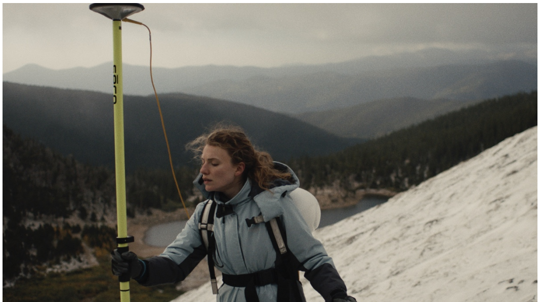
Elegy for a Glacier, R: Stephanie Falkeis

Der Klimawandel sowie dessen ökologische und ökonomische Folgen bestimmen die täglichen Nachrichten. Das Programm widmet sich daran geknüpften Fragestellungen: Wie können wir eine nachhaltigere Beziehung zu unserer Umwelt eingehen? Was tun, wenn Arten sterben und Gletscher schmelzen?