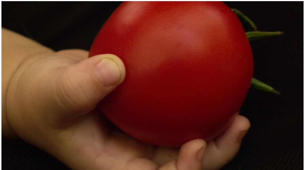
Saying Not Said, R: Christina Stuhlberger

Sogenannte Familienbande verlaufen nie reibungslos. Oft sind sie von Missverständnissen und Irrtümern geprägt, die sich erst im Nachhinein auflösen. In den 3 Filmen geht es um ganz unterschiedliche Familien: jene, in die man hineingeboren wird, und jene, die man sich aussucht. Während in den ersten beiden Arbeiten liebevolle familiäre Beziehungen durch außergewöhnliche Ereignisse und vor allem durch das Miteinander-Sprechen gestärkt werden, ist es im dritten Film eine beinahe unheimliche Konstellation, die Beziehungsprobleme erst so richtig „triggert“.