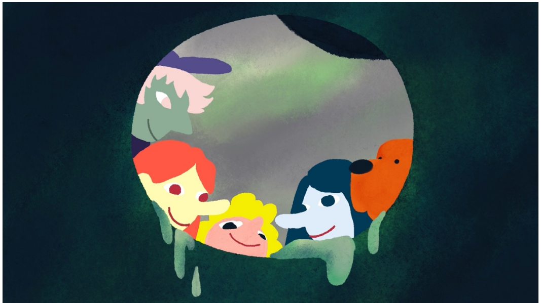
Crush – The Rush , R: Leonie Bramberger

Beide Programme werden von einer Filmvermittler:in der Diagonale begleitet.