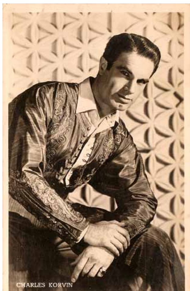
Charles Korvin, Fanpostkarte (1946)

präsentiert von SYNEMA und dem Österreichischen Filmmuseum