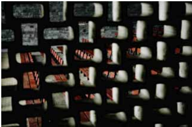
Sofie Thorsen: Schnitt A-A' © Hannes Böck

Eine Koproduktion mit dem Kunsthaus Graz